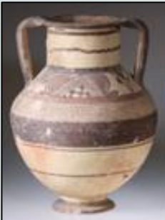
Αμφορέας δίχρωμου IV ρυθμού. Φυτικός διάκοσμος στη ζώνη του ώμου. Κυπροαρχαϊκή περίοδος I (700 π.Χ.)