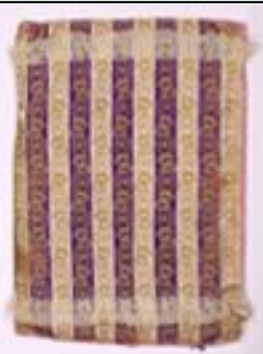
Μαξιλαροθήκη από εξωτερικό ύφασμα με πιπίλλα (δαντέλα).