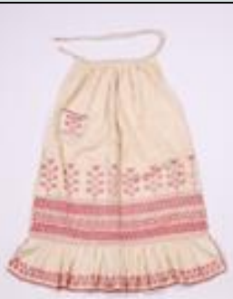
Ποδιά από εξωτερικό ύφασμα καμπρί με κόκκινο κέντημα σταυροβελονιά. Στην τσέπη κεντημένο το όνομα της εκτελέστριας Ροδού Σοφοκλέους 1933