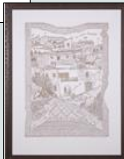
Τα ωραία Λεύκα Χαμπής Τσαγγάρης 1983 (χαρακτική)